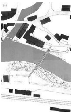
© Marcel Meili, Markus Peter Architekten