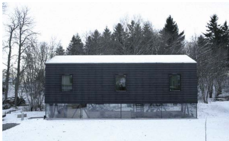
oben: Villa in Ranheim, 2008; rechts: Nachtaufnahme: temporäres Gehäuse in Berlin, 2005

Jede Bauweise hat ihre Schwachpunkte und unbekannteren Faktoren. Die obigen Fragen werden hoffentlich in Zukunft mit Ausreifen der Bautechnik beantwortet werden können. Niemand weiß genau, wie sich ein Gebäude aus Stahlbeton langfristig verhalten wird, aber wir haben heute ein besseres Verständnis seiner Eigenarten als vor hundert Jahren. Mit Sicherheit aber können wir sagen, dass sich aus Stahlbeton exquisite und zweckdienliche Architektur machen lässt. Offenkundig lässt sich damit, wie aus jedem anderen Baumaterial, auch schlechte und wenig nachhaltige Architektur machen. Es ist daher ein großes Privileg, an einer gemeinsamen Anstrengung um eine nachhaltige Architektur für den Massivholzbau teilzuhaben, eine Architektur, die andere bautechnisch etablierte Architekturen ergänzen kann.