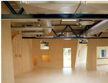
Kindergarten im ehemaligen Autohaus, 2007

einzigste Art, sie korrekt zu fügen. Ein Fehler bei der Montage würde den Bauunternehmer zwingen, die betroffenen Elemente wieder auseinander zu nehmen und von vorne zu beginnen. Um diesem Risiko zu begegnen, werden (unserer Erfahrung nach) Zeichnungen und Beschreibungen sowohl von Herstellern als auch Ausführenden peinlich genau befolgt. Dies gibt dem Architekten mehr Einfluss auf die Qualität des fertigen Gebäudes und gleichzeitig eine größere Verantwortung für die Korrektheit seiner Zeichnungen und Beschreibungen. Der Architekt kann sogar wesentliche Aspekte der Detaillierung in die Form der gefrästen Elemente integrieren, um den Einfluss möglicherweise schlechter Ausführung auf der Baustelle und um die Bauzeit zu verringern.