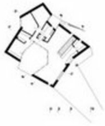
Grundriss EG 1_500