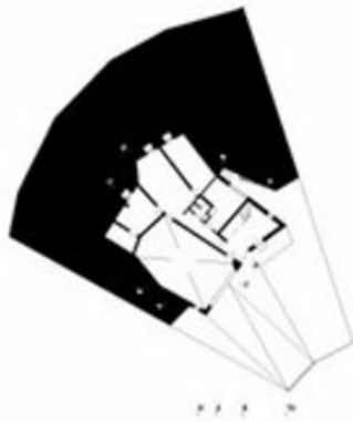
Grundriss KG 1_500