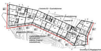
© RLP Rüdiger Lainer + Partner