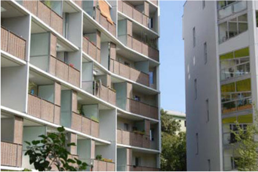
© RLP Rüdiger Lainer + Partner

Der Baukörper mit 63 Wohnungen in Wien-Brigittenau setzt sich aus drei Typologieelementen zusammen, die Rüdiger Lainer aus den städtebaulichen Rahmenbedingungen ableitete. Vor der Großform des Engelshofs dezent zurückweichend, gliedert sich das Volumen in „Kopf“, „Körper“ und „Flosse“, selbstverständlich ohne diese Metaphorik explizit zu bemühen. Der schlanke Baukörper, der durchgesteckte Wohnungen ermöglichte, ist nach dem gründerzeitlichen Prinzip „3 Scheiben und ein Schacht“ aufgebaut, um möglichst elastische Grundstrukturen für maximale Typenvielfalt zu schaffen. Um den Fixpunkt des Schachts sind ein natürlich belichtetes Bad, WC und Küche gruppiert, die übrigen Räumlichkeiten sind in zahlreichen Varianten in die Grundstruktur eingeschrieben. Auch das Prinzip der zuschaltbaren Zimmers sorgt für Flexibilität, da die beiden Zimmer in der Achse des Stiegenhauses entweder Platz für eine kleine 2-Zimmer-Wohnung oder für eine in eine angelagerte Wohnung integrierte Einliegerwohnung schaffen. An der Süd-, Ost- und Westseite des durch drei Stiegenhäuser erschlossenen Wohnbaus ist eine Loggienschicht vorgelagert, die im Sinne einer optimalen Belichtung abschnittsweise mit einem Glasdach versehen ist. Jede Loggia verfügt zudem über einen eigenen Abstellbereich. Die südlich angrenzende Bebauung wurde von Architectos (Heidi Pretterhofer, Dieter Spath) entworfen (siehe gesonderten Eintrag). (Text: Gabriele Kaiser)