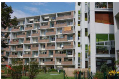
© RLP Rüdiger Lainer + Partner