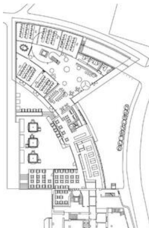
Lageplan, Schnitt, Grundriss OG, EG