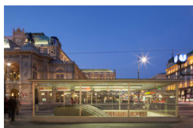
© arge gerner® gerner plus | ritter+ritter | vasko+partner