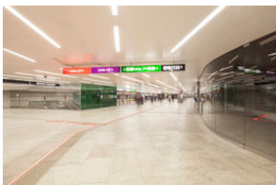
© arge gerner® gerner plus | ritter+ritter | vasko+partner