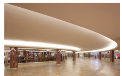
© arge gerner°gerner plus | ritter+ritter | vasko+partner