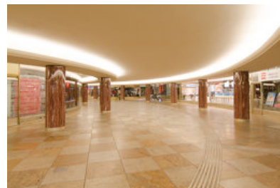
© arge gerner°gerner plus | ritter+ritter | vasko+partner