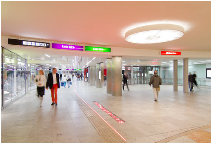
© arge gerner°gerner plus | ritter+ritter | vasko+partner

Der Karlsplatz war in den 1980er Jahren Synonym für Drogenhandel geworden. In der Passage, die den Ring mit dem Karlsplatz und die Secession mit dem Musikverein verbindet, richteten sich Obdachlose in Telefonbuchten ein, deren Apparate mit Kaugummi verklebt waren. Als im Zuge des Radwegeausbaus erstmals wieder oberirdische Querungen über den Ring und den Karlsplatz (die sechsspurige Fahrbahn) möglich wurden, gab es keinen Grund, weiter den subjektiv unsicheren und objektiv unattraktiven Ort zu nutzen. In den vergangenen Jahren wurden zahlreiche Maßnahmen gesetzt, um vor allem die subjektive Sicherheit vor Ort zu erhöhen. Beim Ausgang Resselpark wurde der Stützpunkt „Help U“ vom Fonds Soziales Wien für Drogen- und Suchtkoordination eingerichtet. Geänderte Gesetze (Schutzzone Karlsplatz mit Wegweisungsrecht) bewirkten eine Verlagerung der Drogenszene hin zu weniger prominenten Verkehrsknotenpunkten. 2008 wurde schließlich EU-weit ein offener Wettbewerb ausgeschrieben, den die ARGE gerner°gerner plus | ritter + ritter | vasko+partner mit ihrem Entwurf für eine Kulturpassage für sich entschied.