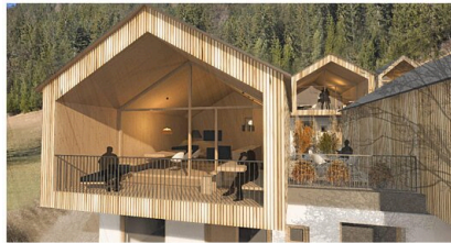
Blickachsen - Loggien - Ausblicke - Intimität