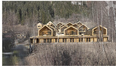
Visualisierung zur Einreichplanung