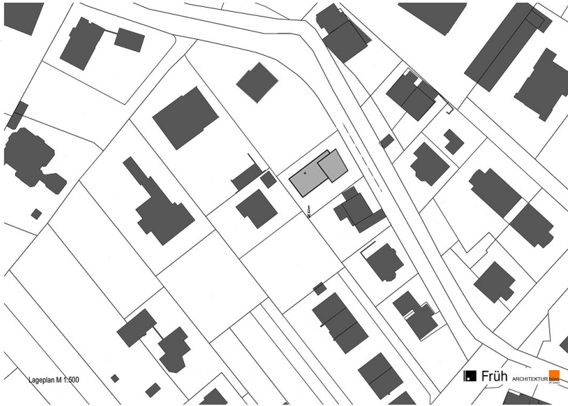
Lageplan M 1:500