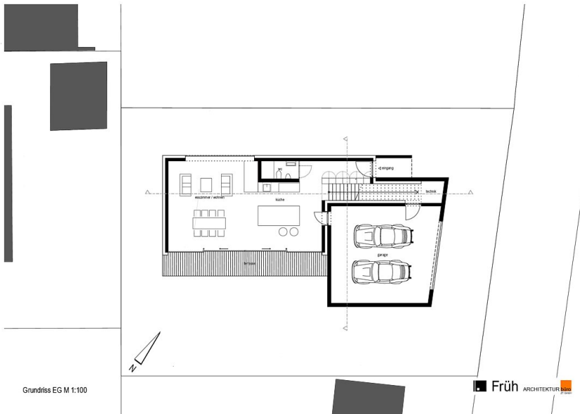
Grundriss EG M 1:100