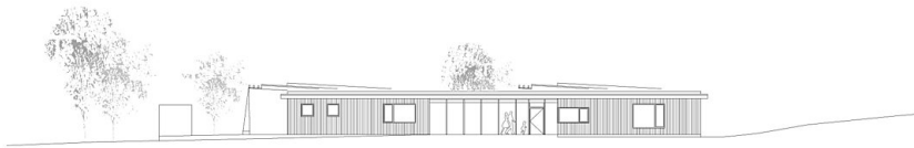
Ansichten Süd & Nord