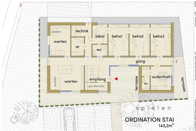
Stai Pub Nextroom