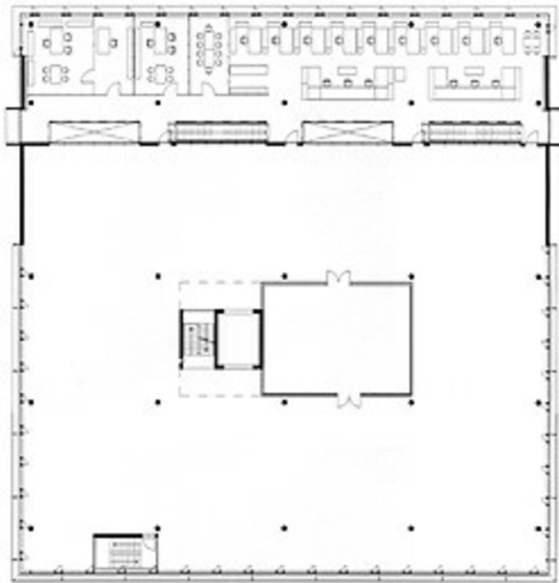
Produktionsbetrieb „Glatz Schilder“