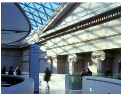
© Nigel Young / Foster + Partners

Bilder aus der Mitte des 19. Jahrhunderts zeigen einen weiten offenen Raum, in dem auf Rasenflächen und Wegen viktorianisch gekleidete Personen lustwandeln. Da zieht ein Gärtner eine Mähmaschine, dort wird offenbar gerade umgegraben. Es sind Momentaufnahmen von einer Zeit, die nicht lange währen sollte. Denn die Grünanlage - der Innenhof des Britischen Museums in London - blieb nur wenige Jahre lang der Freiraum, als der er gedacht war. 1857 wurde in der Mitte des Gartens der Lesesaal der British Library fertig gestellt, und was an Beständen drinnen keinen Platz fand, wurde außerhalb untergebracht. Regale voller Bücher nahmen den Hof ein, in den in Kürze nur mehr Bibliothekare vordringen durften, so wie zum Lesesaal nur die Auserwählten Zugang hatten. Die ursprüngliche Idee des Innenhofs als, wie es der britische Stararchitekt Norman Foster ausdrückte, „Herz des Museums“, geriet rasch in Vergessenheit, der so genannte Great Court wurde zu „einem der verlorenen Räume Londons.“