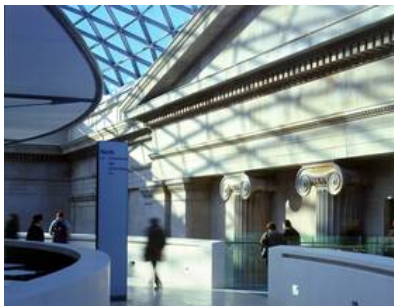
© Nigel Young / Foster + Partners

Bilder aus der Mitte des 19. Jahrhunderts zeigen einen weiten offenen Raum, in dem auf Rasenflächen und Wegen viktorianisch gekleidete Personen lustwandeln. Da zieht ein Gärtner eine Mähmaschine, dort wird offenbar gerade umgegraben. Es sind Momentaufnahmen von einer Zeit, die nicht lange währen sollte. Denn die Grünanlage - der Innenhof des Britischen Museums in London - blieb nur wenige Jahre lang der Freiraum, als der er gedacht war. 1857 wurde in der Mitte des Gartens der Lesesaal der British Library fertig gestellt, und was an Beständen drinnen keinen Platz fand, wurde außerhalb untergebracht. Regale voller Bücher nahmen den Hof ein, in den in Kürze nur mehr Bibliothekare vordringen durften, so wie zum Lesesaal nur die Auserwählten Zugang hatten. Die ursprüngliche Idee des Innenhofs als, wie es der britische Stararchitekt Norman Foster ausdrückte, „Herz des Museums“, geriet rasch in Vergessenheit, der so genannte Great Court wurde zu „einem der verlorenen Räume Londons.“