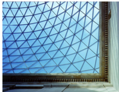
© Nigel Young / Foster + Partners