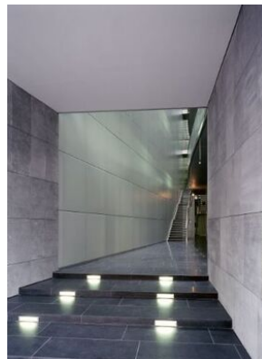
© Jörg Hempel / ARTUR IMAGES