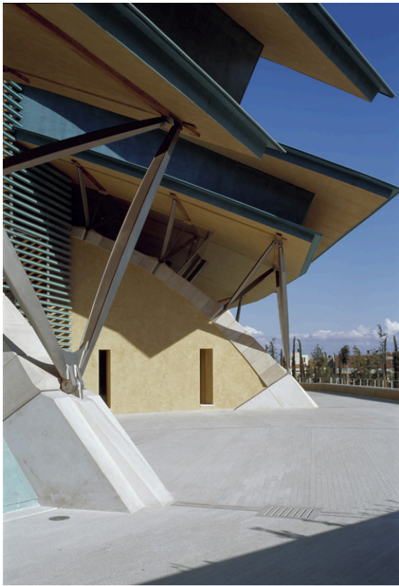
© Paul Raftery / ARTUR IMAGES