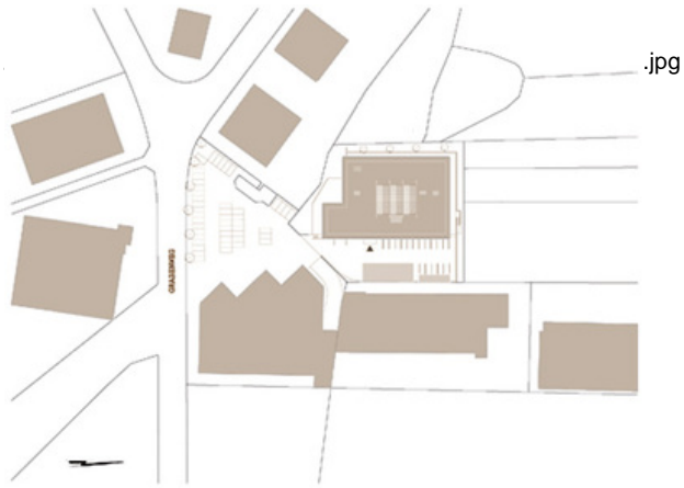
CCI - Competence Center Innsbruck