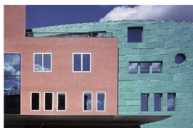
© Reinhard Görner / ARTUR IMAGES