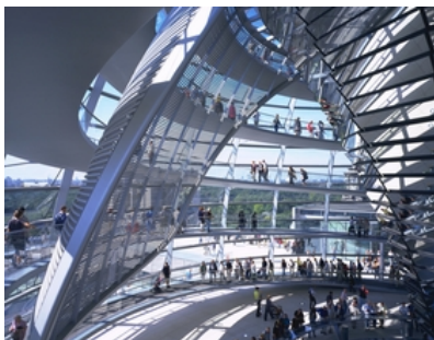
© Nigel Young / Foster + Partners

Insgesamt vier Ebenen haben die Planer in diesem Gebäude übereinandergeschichtet. Jede von ihnen ist durch eine eigene Farbgebung