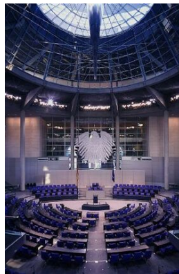
© Werner Huthmacher / ARTUR IMAGES