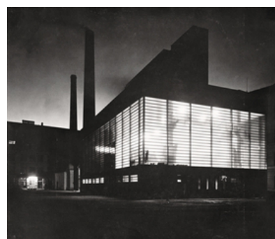
© Julius Scherb / profil 1933