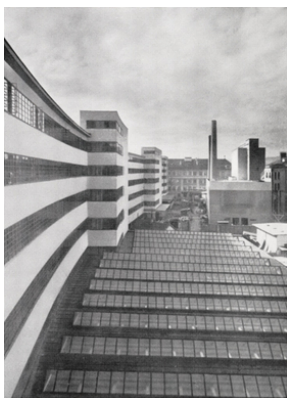
1933