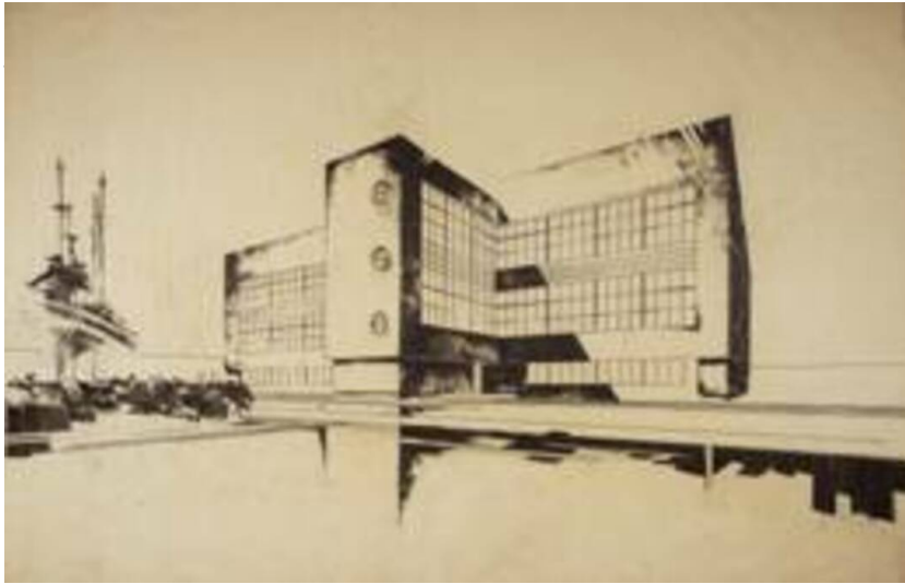
Mädchen - Hauptschule Vöcklabruck