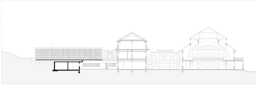
HLA und Ferienhort Ried am Wolfgangsee