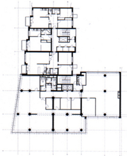
Pôdorys 6. NP