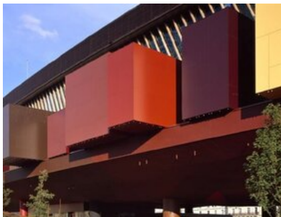
© Roland Halbe / ARTUR IMAGES

Reliquien-Fisch und Ahnenkult, Olga Grimm-Weissert, Der Standard, 21.06.2006