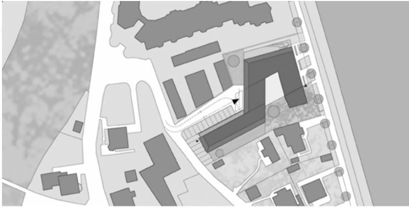
Sonderpädagogisches Zentrum Hallein