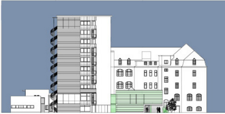
RIK Radiologisches Institut Kettenbrücke