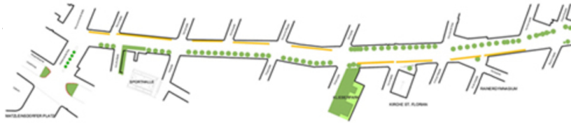
Neugestaltung Wiedner Hauptstraße