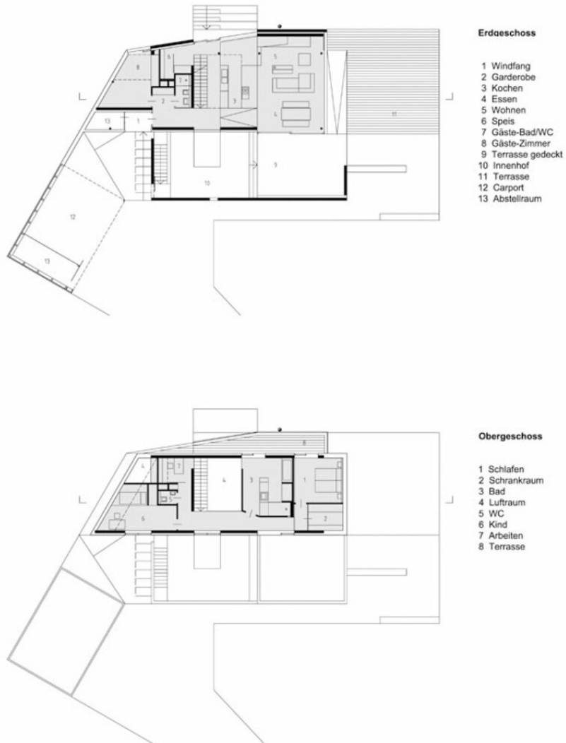
Grundriss EG, OG