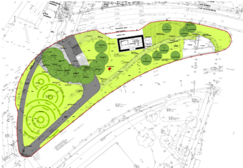
Giradipark / Esperantopark