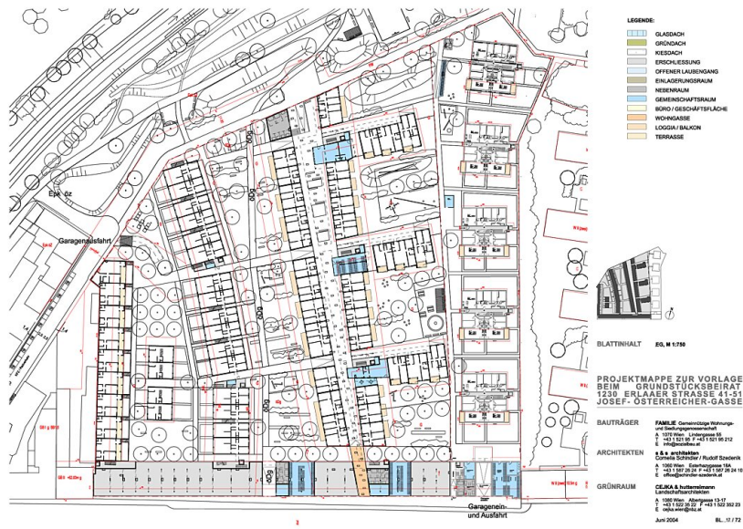
WHA Erlaaer Straße Lageplan