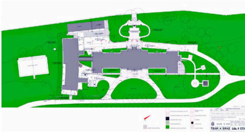
Psychiatrische Universitätsklinik LKH Graz