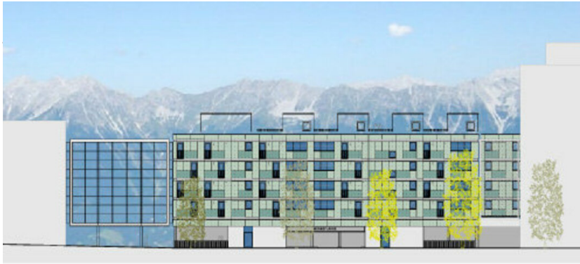
Wohnbau „Leben am Tivoli“ und „Office am Tivoli“ – Bauteil 1