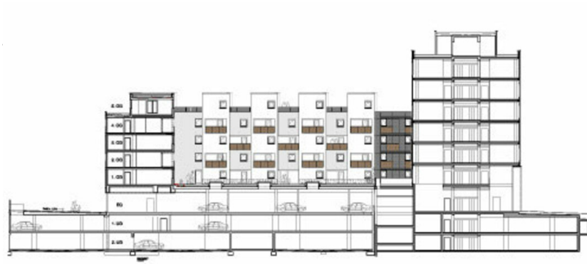
Wohnbau „Leben am Tivoli“ und „Office am Tivoli“ – Bauteil 1