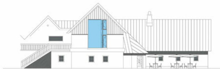
ANSICHT NORD - WEST