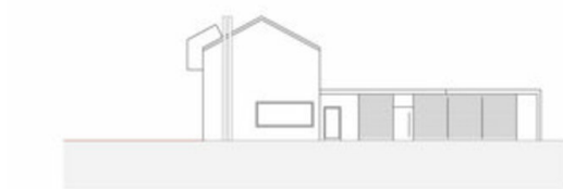
Ansicht Nord-West 1|200