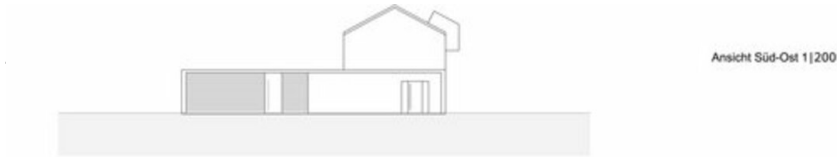
Ansicht Süd-Ost 1|200