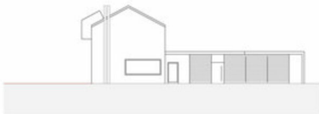
Ansicht Nord-West 1|200