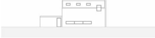
Ansicht Nord-Ost 1|200