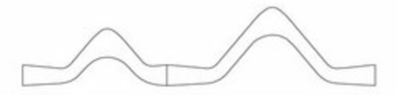
tatsächliche Aussenlinie Aussenelement Abwicklung