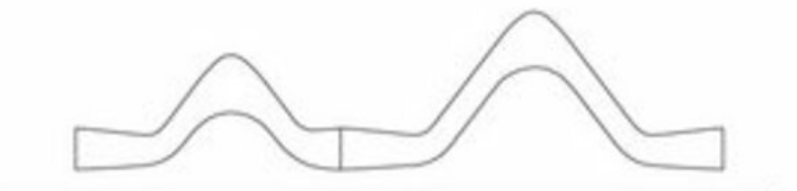
tatsächliche Innenlinie Aussenelement Abwicklung