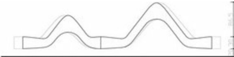
Tatsächliche Ansicht Aussenelement (verschnitten)