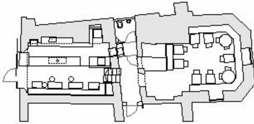
BarRestaurant niu - Umbau