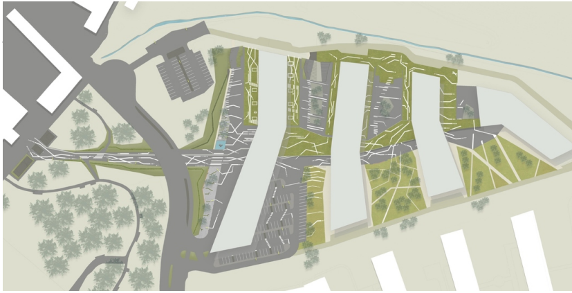
Science Park Linz – Bauteil 1