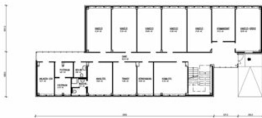
0 1 2 3 4 5 ERDGESCHOSS