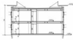
0 1 2 3 4 5 QUERSCHNITT