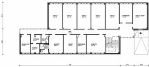
0 1 2 3 4 5 ERDGESCHOSS