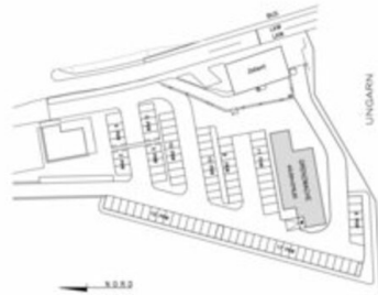
0 5 10 15 20 25 LAGEPLAN