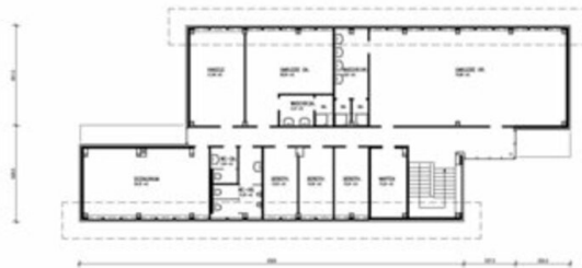
0 1 2 3 4 5 OBERGESCHOSS