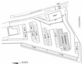
0 5 10 15 20 25 LAGEPLAN