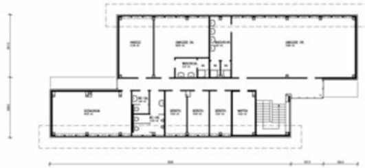
0 1 2 3 4 5 OBERGESCHOSS