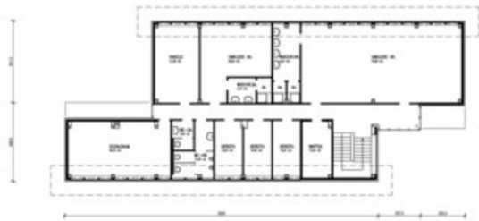
0 1 2 3 4 5 OBERGESCHOSS