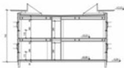
0 1 2 3 4 5 QUERSCHNITT