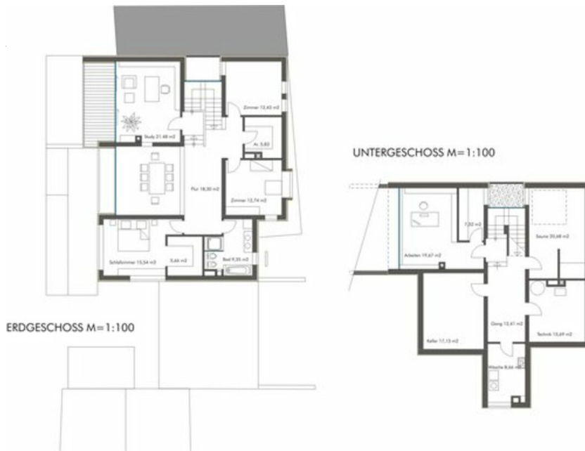
Grundriss OG, KG