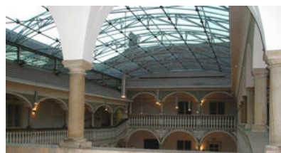
© Stadtgemeinde St. Veit an der Glan