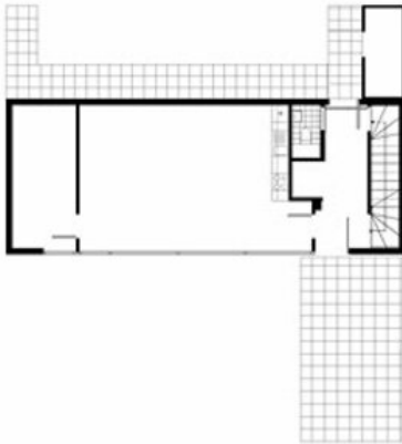
ERDGESCHOSS + OBERGESCHOSS