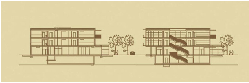
Seniorenwohnanlage Völkermarkt, Zu- und Umbau