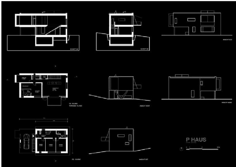
Grundrisse, Ansichten, Schnitte