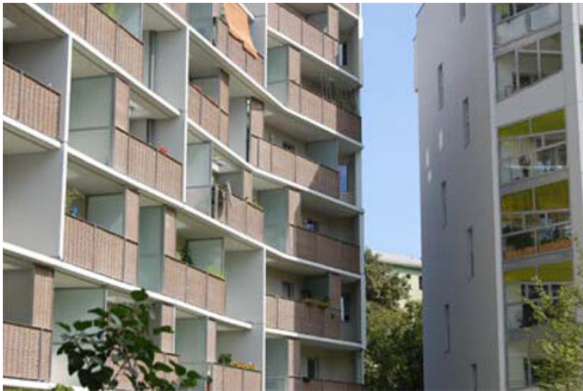
© RLP Rüdiger Lainer + Partner