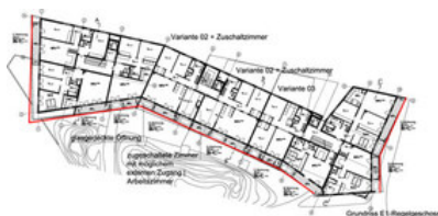
© RLP Rüdiger Lainer + Partner

Der Baukörper mit 63 Wohnungen in Wien-Brigittenau setzt sich aus drei Typologieelementen zusammen, die Rüdiger Lainer aus den städtebaulichen Rahmenbedingungen ableitete. Vor der Großform des Engelshofs dezent zurückweichend, gliedert sich das Volumen in „Kopf“, „Körper“ und „Flosse“, selbstverständlich ohne diese Metaphorik explizit zu bemühen. Der schlanke Baukörper, der durchgesteckte Wohnungen ermöglichte, ist nach dem gründerzeitlichen Prinzip „3 Scheiben und ein Schacht“ aufgebaut, um möglichst elastische Grundstrukturen für maximale Typenvielfalt zu schaffen. Um den Fixpunkt des Schachts sind ein natürlich belichtetes Bad, WC und Küche gruppiert, die übrigen Räumlichkeiten sind in zahlreichen Varianten in die Grundstruktur eingeschrieben. Auch das Prinzip der zuschaltbaren Zimmers sorgt für Flexibilität, da die beiden Zimmer in der Achse des Stiegenhauses entweder Platz für eine kleine 2-Zimmer-Wohnung oder für eine in eine angelagerte Wohnung integrierte Einliegerwohnung schaffen. An der Süd-, Ost- und Westseite des durch drei Stiegenhäuser erschlossenen Wohnbaus ist eine Loggienschicht vorgelagert, die im Sinne einer optimalen Belichtung abschnittsweise mit einem Glasdach versehen ist. Jede Loggia verfügt zudem über einen eigenen Abstellbereich. Die südlich angrenzende Bebauung wurde von Arquitectos (Heidi Pretterhofer, Dieter Spath) entworfen (siehe gesonderten Eintrag). (Text: Gabriele Kaiser)