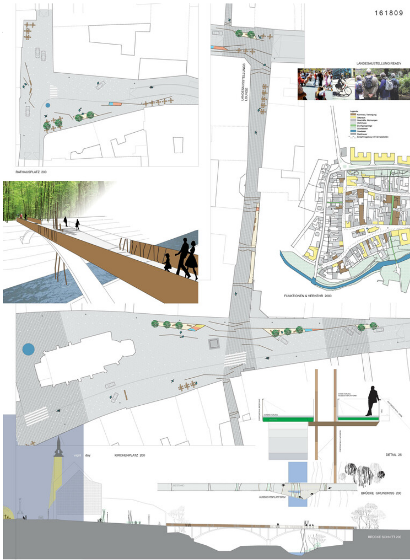
NEUGESTALTUNG STADTZENTRUM HORN