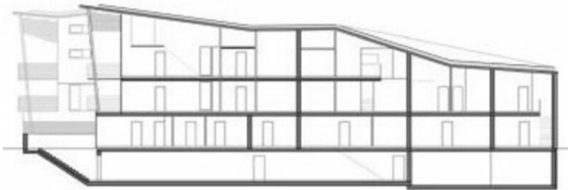
HAUS TYP A SCHNITT M 1:250