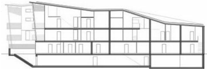
HAUS TYP A SCHNITT M 1:250