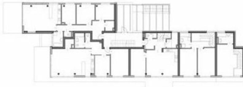
HAUS TYP A OBERGESCHOSS M 1:250