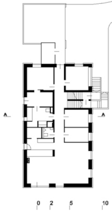
Schnitt + EG