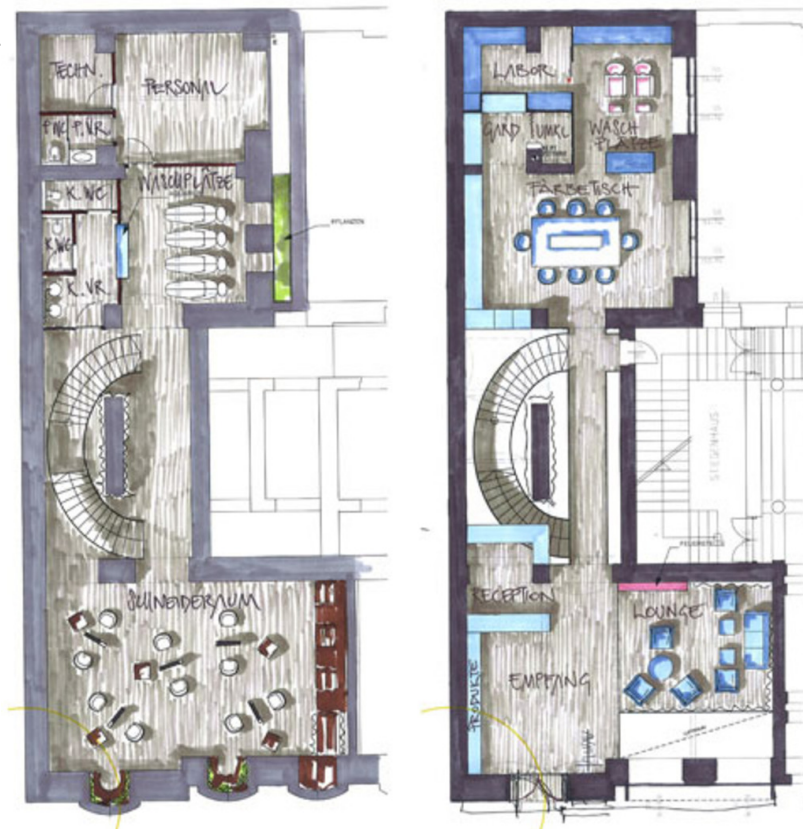
Beauty- und Stylinglounge b.lounge