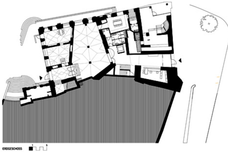
ERDGESCHOSS 1 5