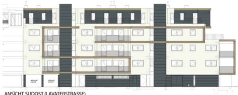
ANSICHT SUDOST (LAVATERSTRASSE)