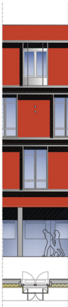
GRUNDRISS | 1:100