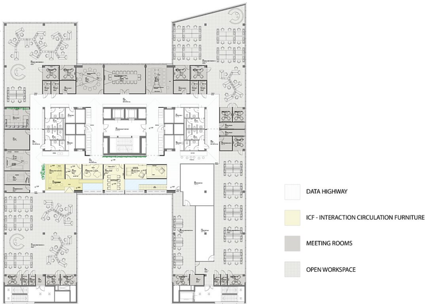
Grundriss 2. Obergeschoss