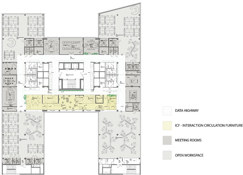
Grundriss 1. Obergeschoss